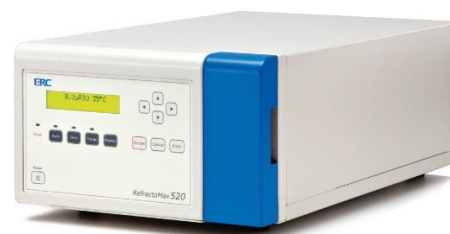
Рис. 5. Детектор рефрактометрический модель RefractoMax 520 и RefractoMax 521.