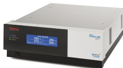
Рис. 2. Детектор спектрофотометрический MWD 3000 (RS) или на диодной матрице DAD 3000 (RS).