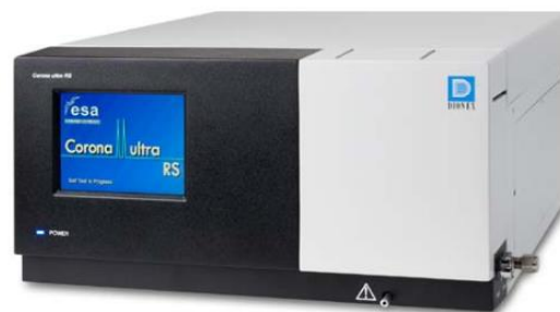
Рис. 7. Детектор заряженного аэрозоля Corona ultra RS и Corona Veo.