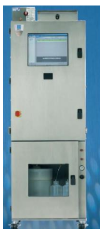
Рис.10.1 Общий вид защитного кожуха для установки хроматографа Ultimate 3000 в систему "Integral".