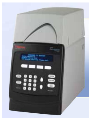
Рис. 8 Детектор электрохимический Coulchem.