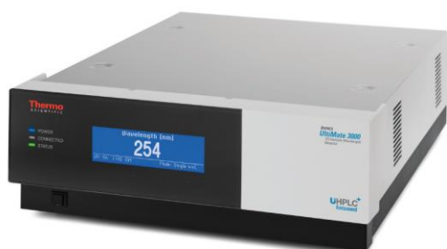
Рис. 1. Детектор спектрофотометрический WVD 3100 и WVD 3400RS.