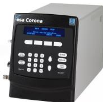
Рис. 6. Детектор заряженного аэрозоля Corona CAD.