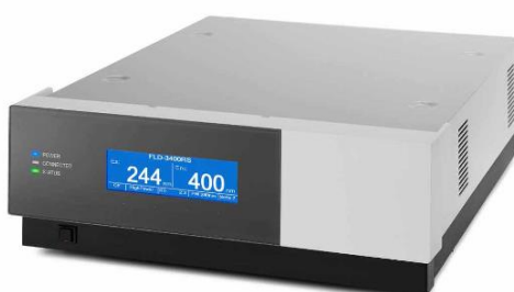
Рис. 3. Детектор флуориметрический FLD 3100 и FLD 3400RS.