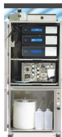
Рис.10.2 Расположение хроматографа Ultimate 3000 в защитном кожухе системы "Integral".