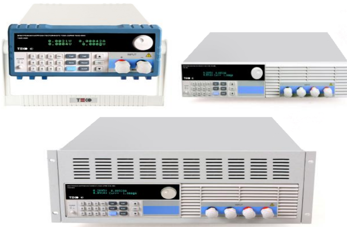
Рисунок 1. Фотография общего вида нагрузок электронных серии ТЕКО-9000

Внешний вид нагрузок и места пломбировки от несанкционированного доступа приведены на рисунке 1 и рисунке 2.