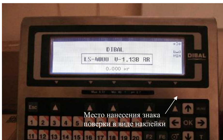
Рисунок 4– Место нанесения знака поверки

Знак поверки в виде наклейки наносится на корпус устройств пульта управления АВУ