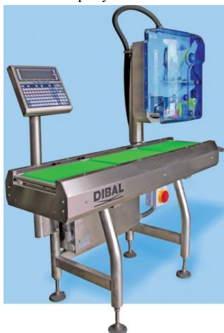
Рисунок 1 - Общий вид устройств LS 3000

Общий вид устройств показан на рисунках 1 - 2.