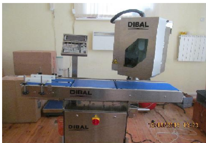
Рисунок 2 - Общий вид устройств LS 4000

Принцип действия устройств основан на преобразовании деформации упругого элемента тензорезисторного датчика, возникающей под действием силы тяжести взвешиваемого груза, в аналоговый электрический сигнал, изменяющийся пропорционально массе груза. Результаты взвешивания выводятся на дисплей весоизмерительного прибора и могут быть переданы на внешние периферийные устройства (например, ПК или принтер) через различные интерфейсы (RS232, Ethernet, USB и др.).