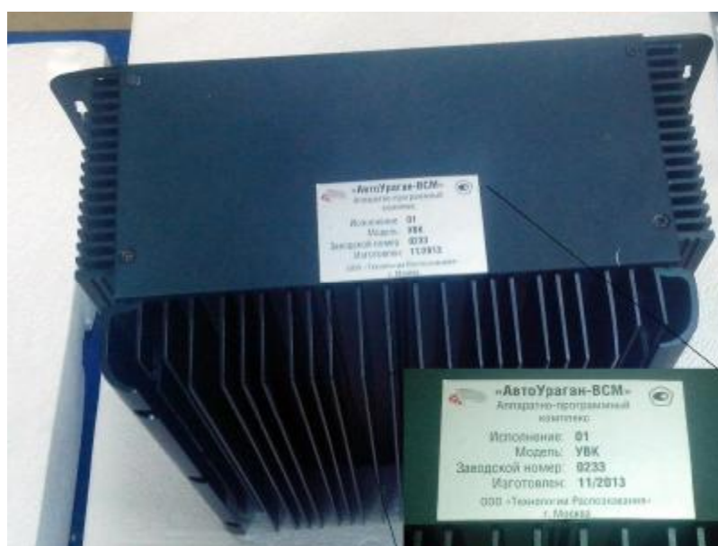
Рисунок 4 – Компьютер промышленный уличный для исполнения 01