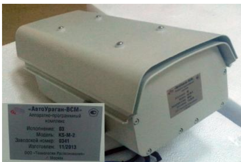
Рисунок 3 - Внешний вид видеоустройства модели KS (комбинированное с компьютером)