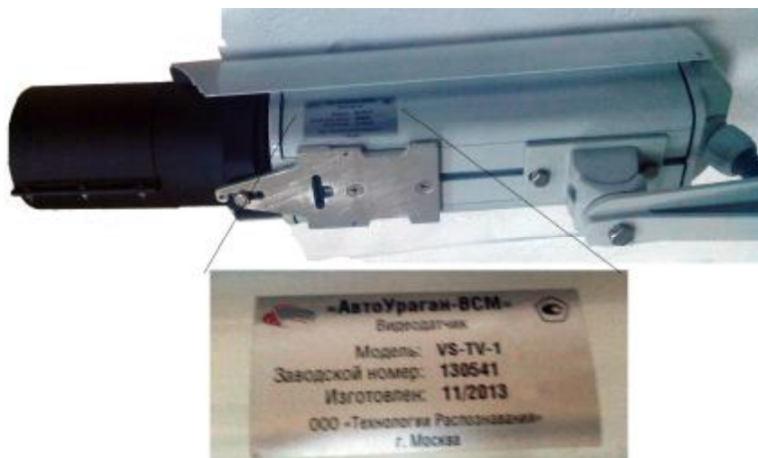
Рисунок 2 - Внешний вид видеоустройства модели VS