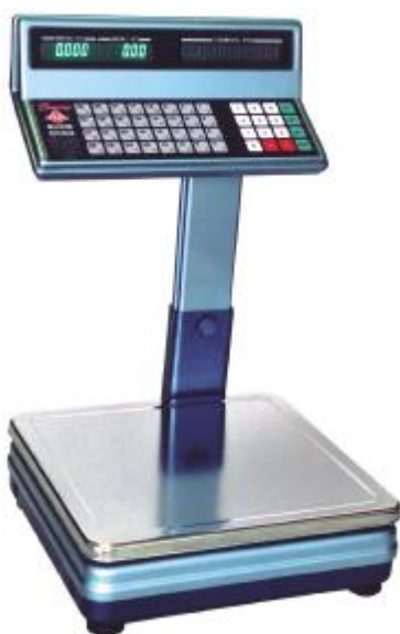
BP 4149-12, BP 4149-13