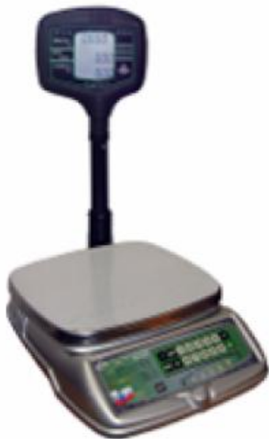
BP 4149-10A, BP 4149-11A