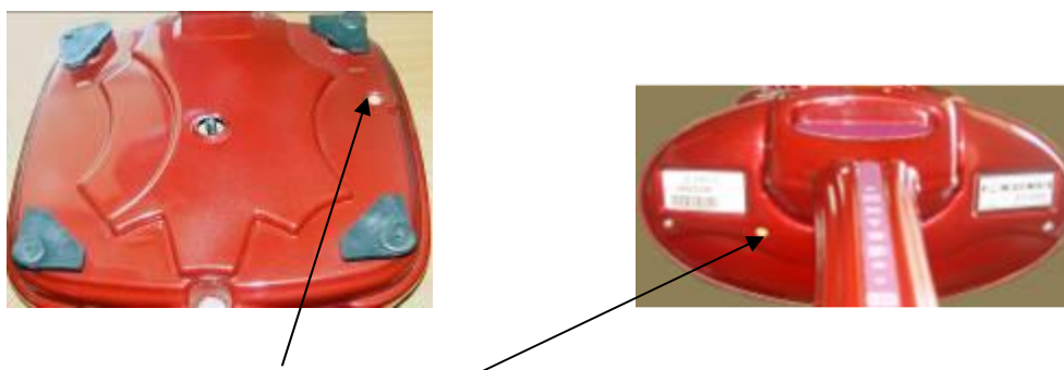
Места расположения пломб весов ВР 4149-14, ВР 4149-15