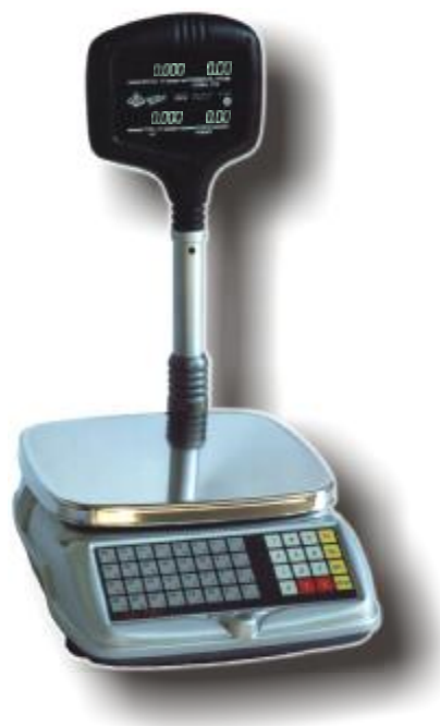
BP 4149-10, BP 4149-11