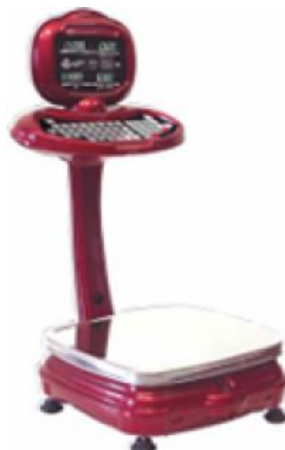
BP 4149-14, BP 4149-15