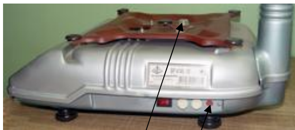
Места расположения пломб весов ВР 4149-10, ВР 4149-11