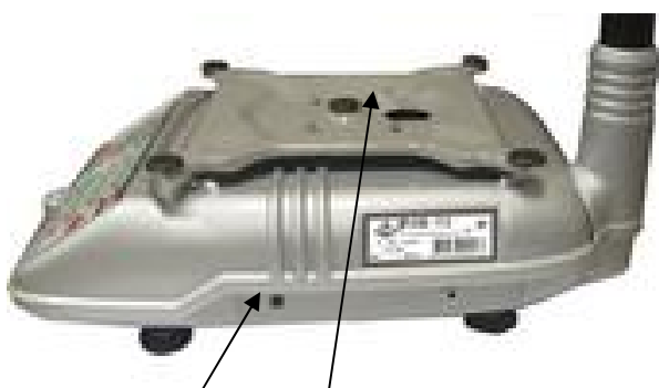
Места расположения пломб весов ВР 4149-10А, ВР 4149-11А