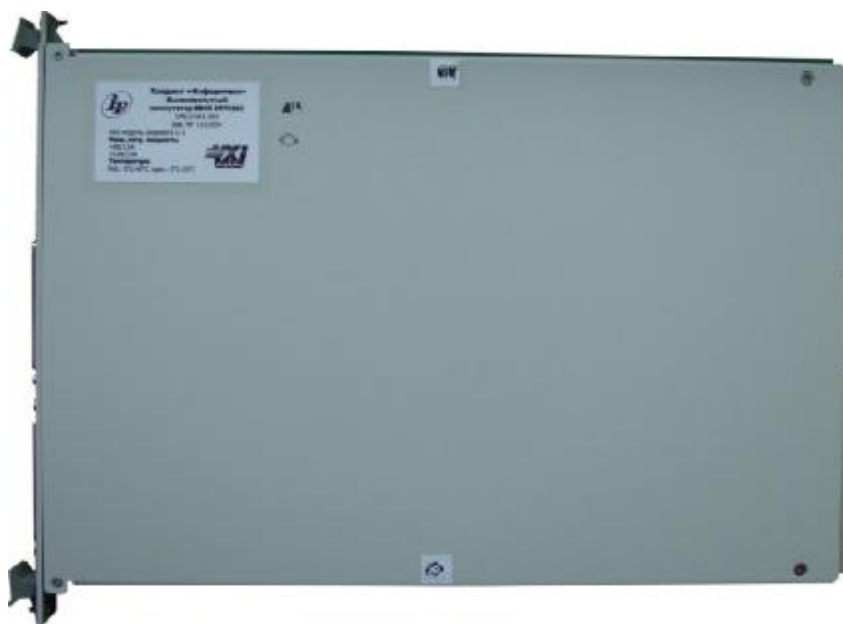
Рисунок 2 –Пломбировка функционального модуля