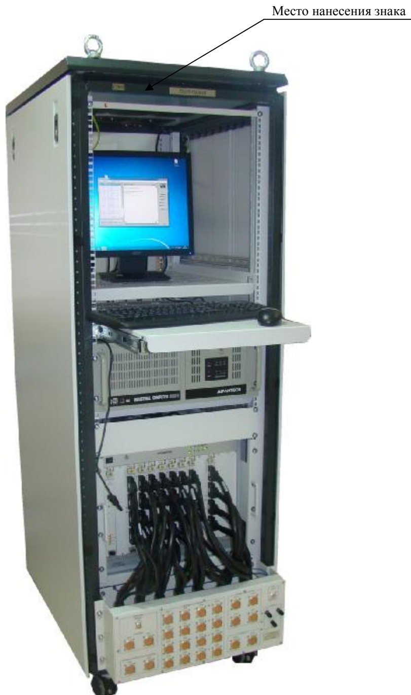
Рисунок 1 – Внешний вид системы

Внешний вид системы с указанием места нанесения знака утверждения типа приведен на рисунке 1. Защита от несанкционированного доступа предусмотрена в виде пломбировки функциональных модулей, установленных в базовый блок (рисунок 2).