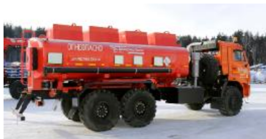
Рисунок 2 - С четырьмя отсеками