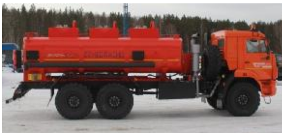
Рисунок 1 - С тремя отсеками