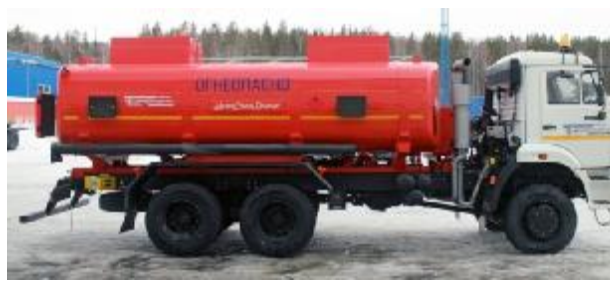
Рисунок 2 – АЦ с двумя отсеками