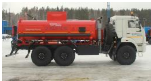
Рисунок 1 – АЦ с одним отсеком

Внешний вид АЦ представлен на рисунке 1, 2,3,4. Место пломбирования обозначено на рисунке 5, 6 и 7.