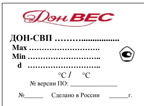
Рисунок 3 Маркировка весов платформенных электронных ДОН-СВП

Маркировка весов производится на планке, закрепленной и опломбированной на задней поверхности корпуса индикатора, на грузоприемном устройстве, на которой нанесено: