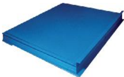
Т- напольная с ограждениями