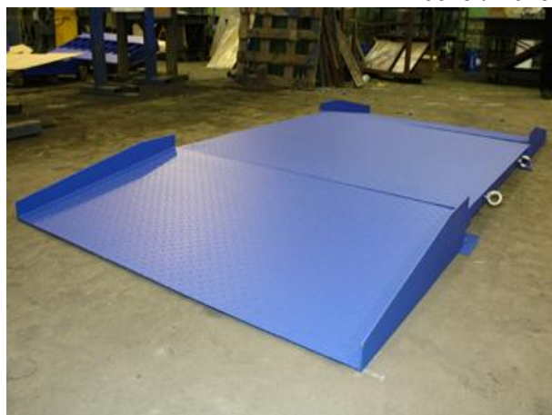
Н- напольная с пандусами