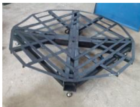
Б- для взвешивания емкостей