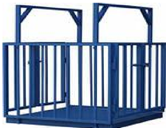
Ж- для взвешивания животных