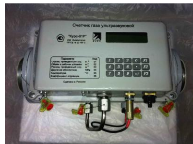
Исполнение КТ КД