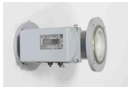
Исполнение А (фланцевое)