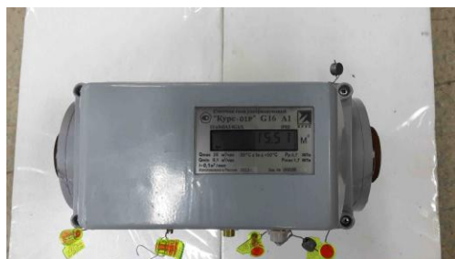
Исполнение А (резьбовое)