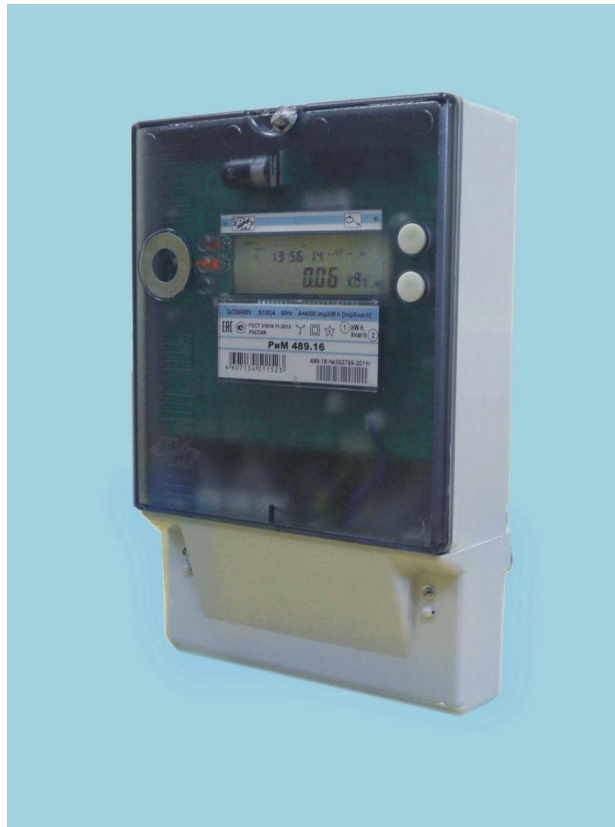
Рисунок 1 – Общий вид счетчика