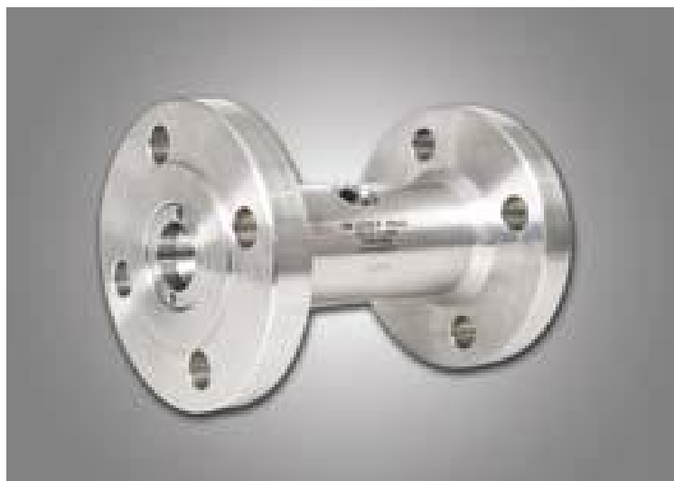
Рисунок 1 - Расходомер турбинный НМ 065.71 FDE160-TC15-G

Корпус электроники вращается на 360°, окно дисплея можно ступенчато вращать на 90°, обеспечивая оптимальное считывание показаний. Внешний вид расходомера и места пломбирования вычислителя показаны на рисунках 1 и 2.