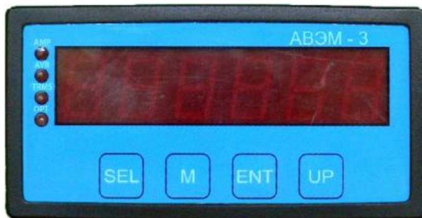
Рисунок 2 – Прибор измерительный АВЭМ-3. Передняя панель.