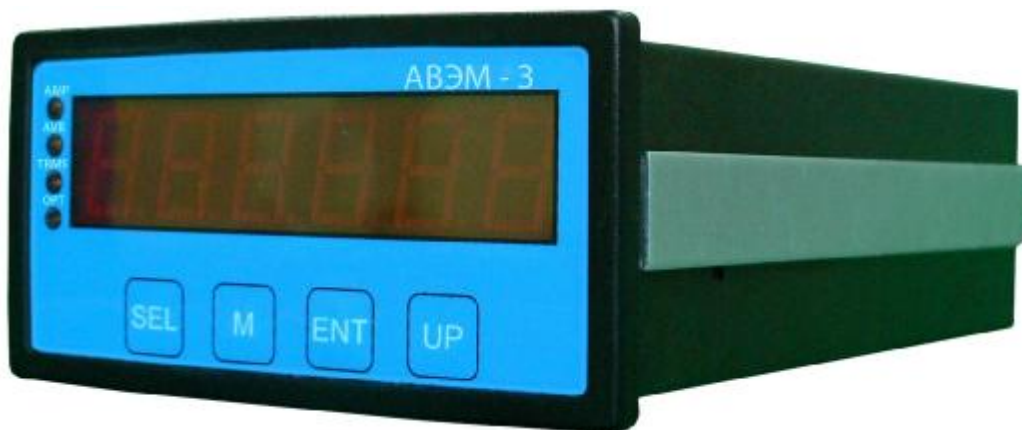
Рисунок 1 – Прибор измерительный АВЭМ-3. Внешний вид

Примечание: В таблице 1 приведены амплитудные значения переменного напряжения.