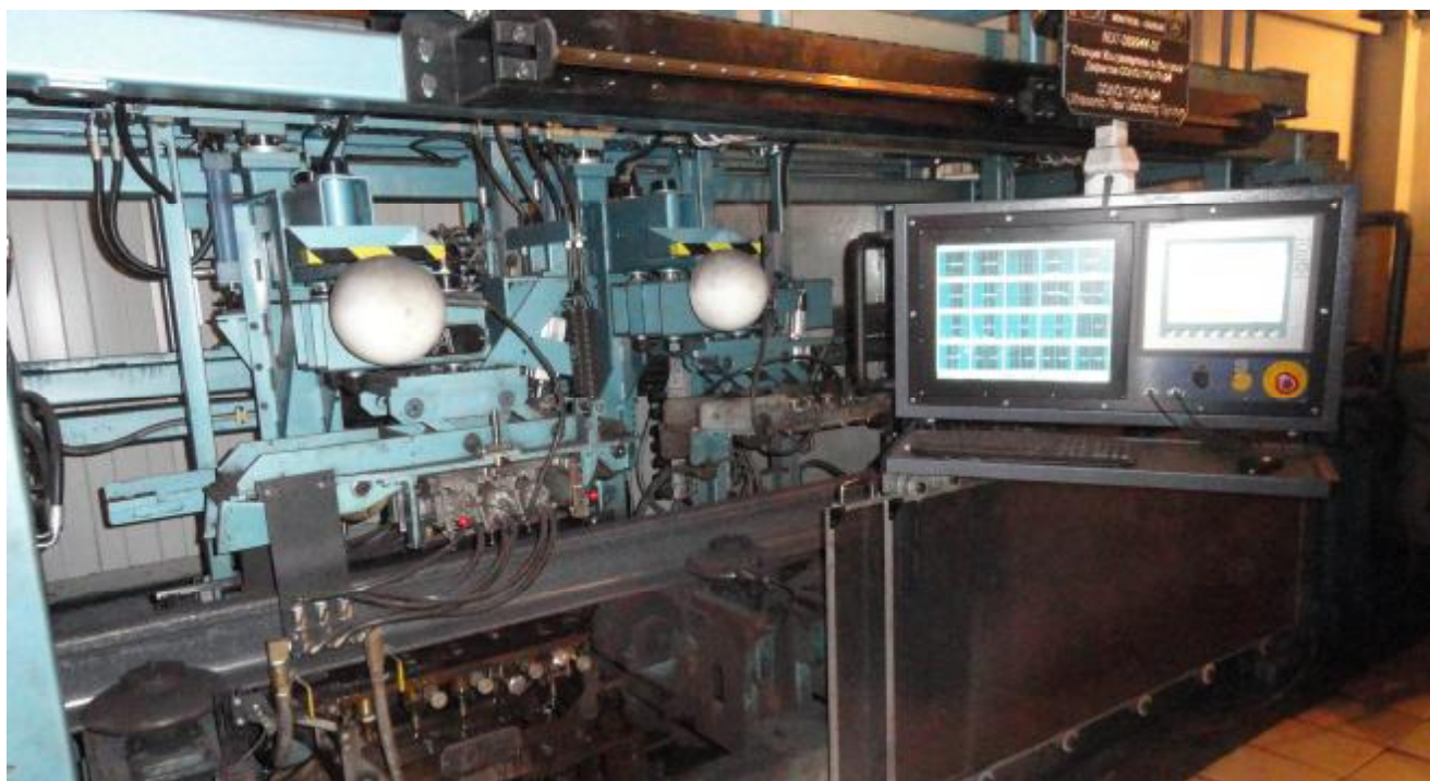
Рисунок 1 – Общий вид системы

На рисунке 1 представлена фотография общего вида системы.