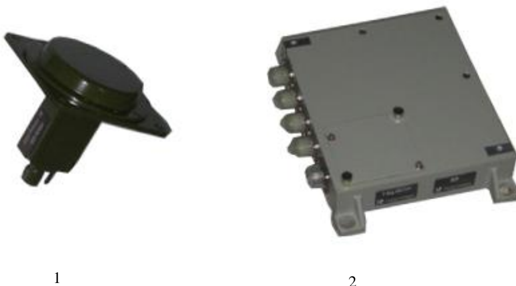
1 – модуль антенный МА3-СО, 2 – блок электронный

Место нанесения наклейки «Знак утверждения типа» и схема пломбировки аппаратуры от несанкционированного доступа приведена на рисунке 2.