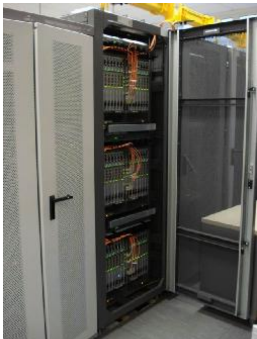
Рисунок 1- Общий вид оборудования с открытой дверью

Общий вид оборудования и место блокирования от несанкционированного доступа, представлены на рисунках 1 и 2.