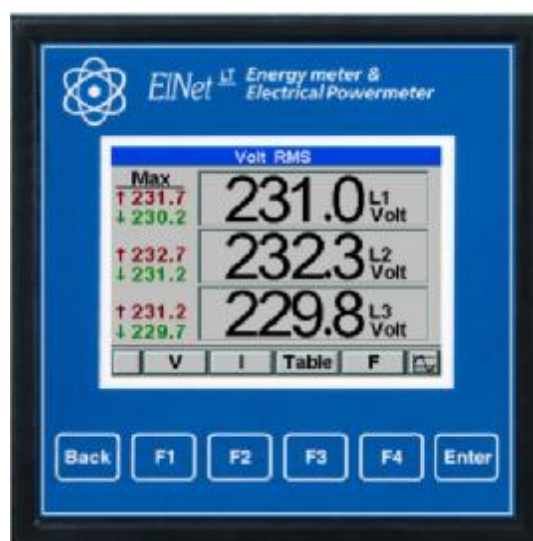
Модификация LT, LTL, LTP