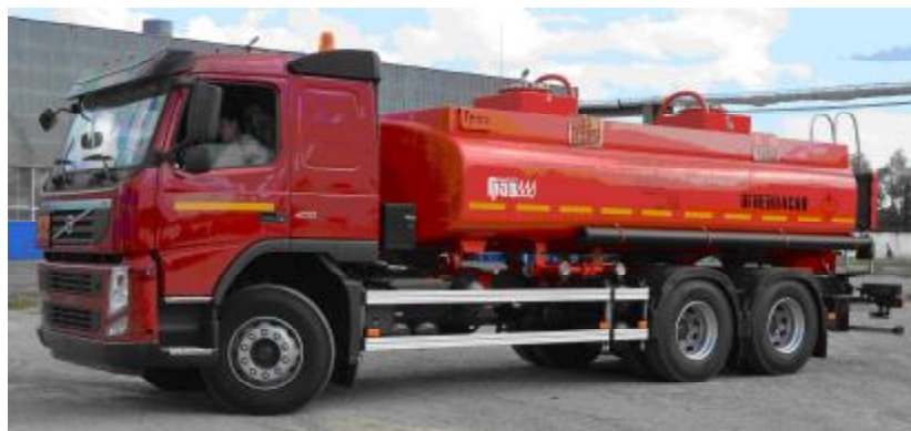
Фото 1. Общий вид автоцистерны ГРАЗ-АЦ-15,0

В зависимости от материала (сталь или алюминиевый сплав) цистерны имеют варианты исполнения М1 и М2.