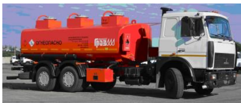
Фото 2. Общий вид автотопливозаправщика ГРАЗ-АТЗ-17,0.