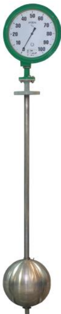
Рисунок 1 - Внешний вид уровнемера УПП1

Внешний вид уровнемера УПП1 представлен на рисунке 1.