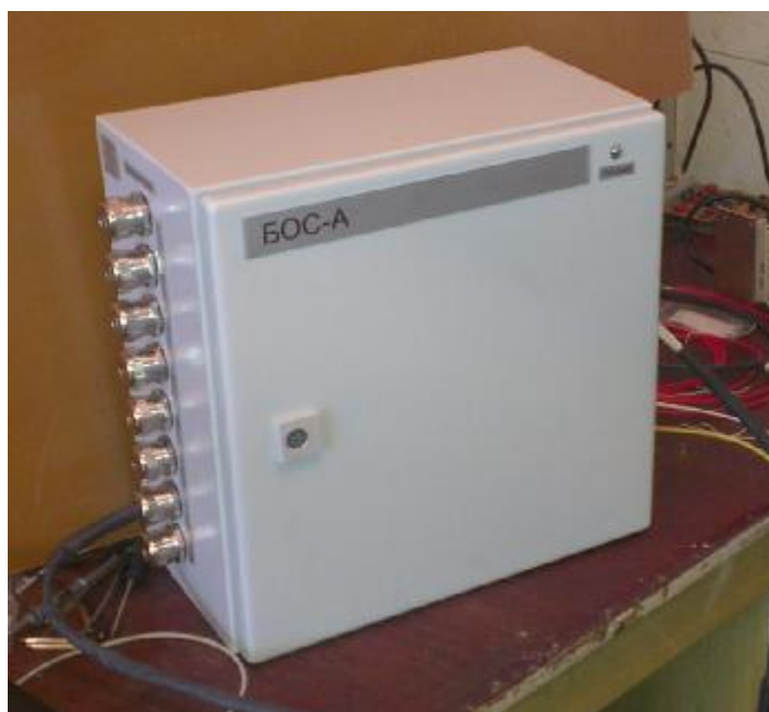
Рисунок 3 - Внешний вид блока обработки сигналов БОС-А