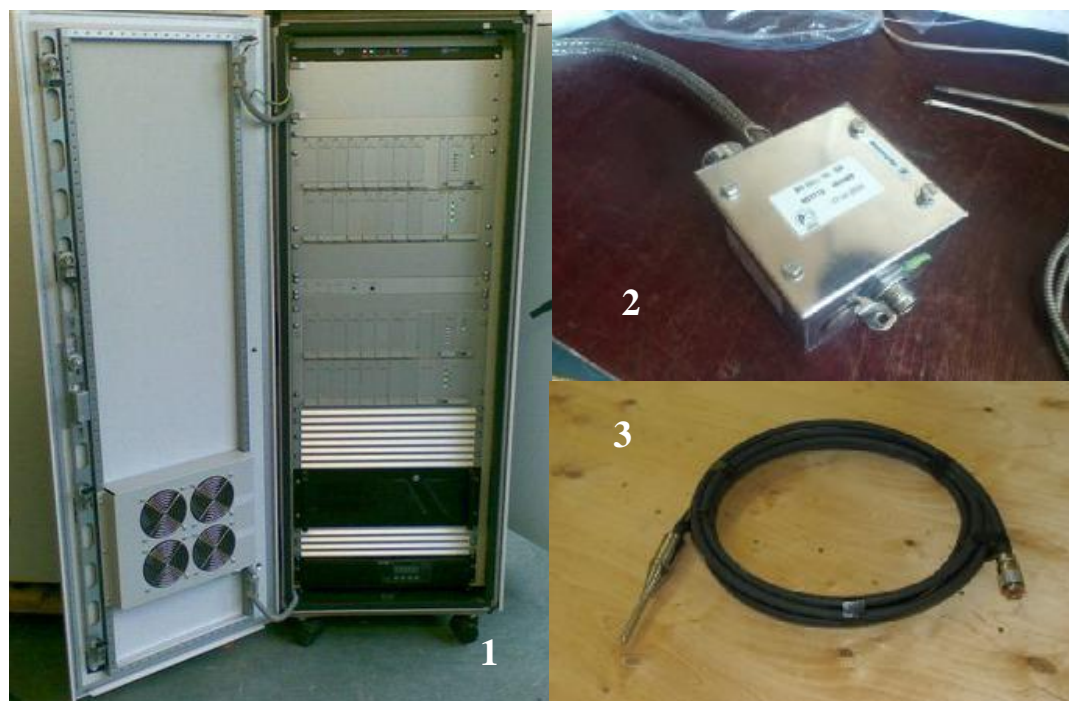
Рисунок 1 - Составные части системы: 1. Устройства информационно-измерительные УИ-ххАЦ; 2. Коммутационная коробка КК-А; 3. Акустический датчик GT400