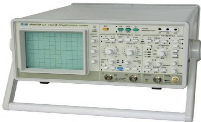
Рисунок 1 - Внешний вид осциллографа С1-157/4

Схема пломбировки осциллографов от несанкционированного доступа приведена на рисунке 4.