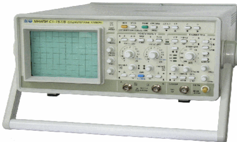
Рисунок 2 - Внешний вид осциллографа С1-157/5