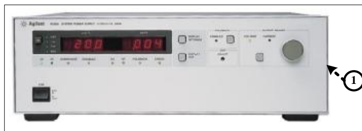
Рисунок 2 – Калибраторы/мультиметры (модели 2400, 2410, 2430) рабочих мест №1 и №2. Вид спереди

Примечание: ① - место для нанесения оттисков клейм или размещения наклеек