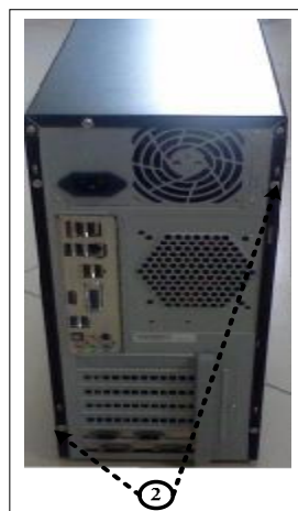
Примечание: ② - места пломбировки от несанкционированного доступа. Рисунок 4 – Управляющая ПЭВМ рабочих мест №1, №2. Вид сзади