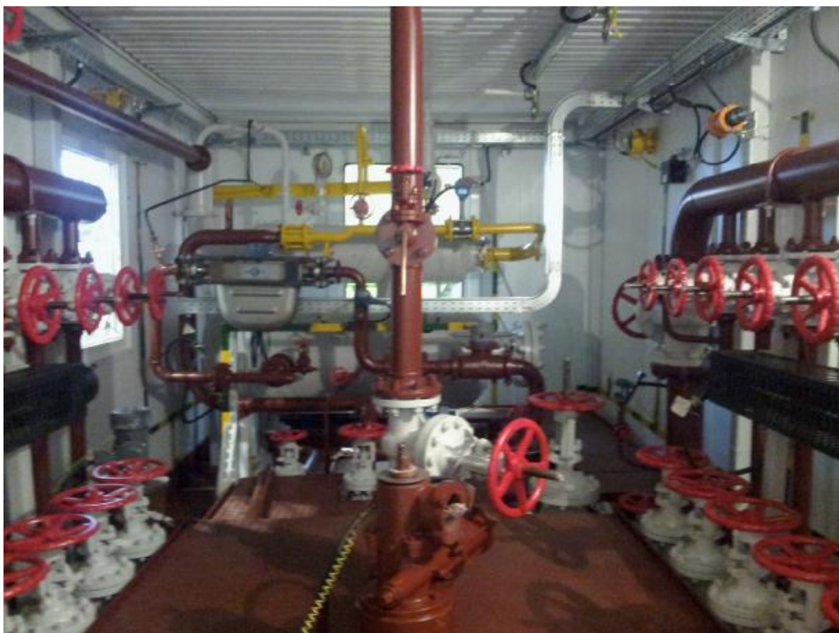
Рисунок 1 - Установка измерительная «Мера-ММ.31». Общий вид.

Общий вид установки приведен на рисунке 1.