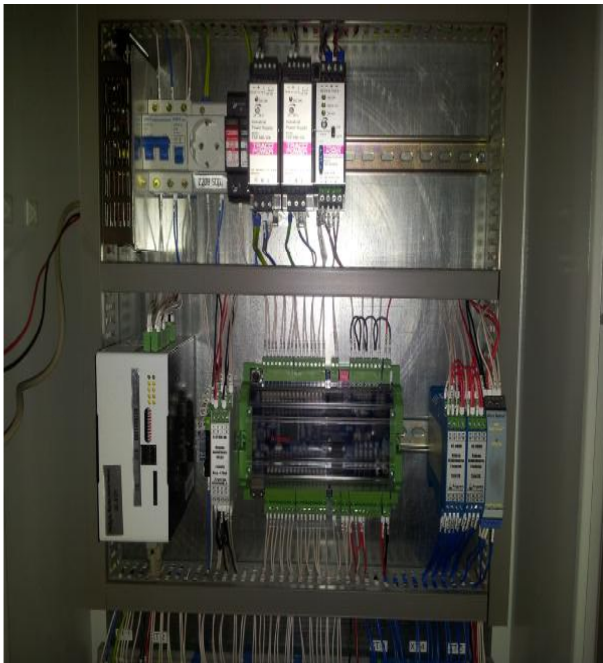
Рисунок 3 - Общий вид контроллеров АТ-8000