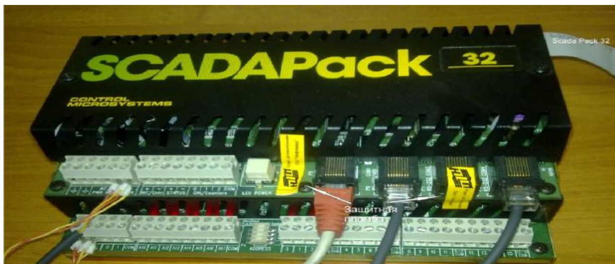
Рисунок 4 - Схема пломбирования контроллера «SCADAPack32»