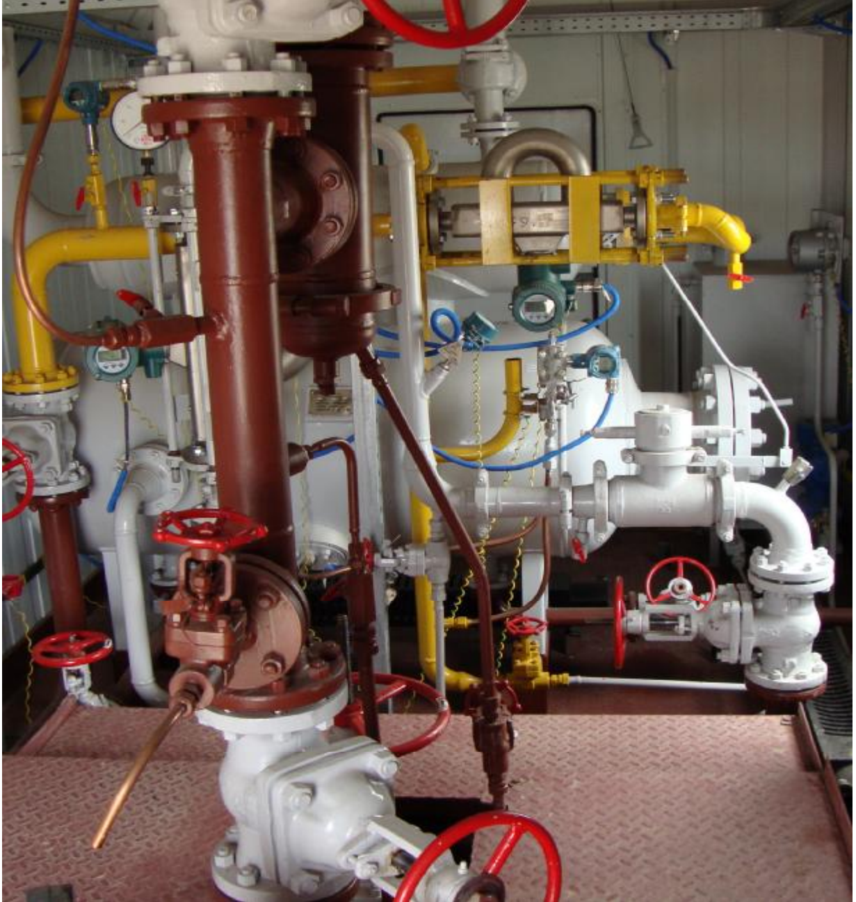
Рисунок 1 - Установка измерительная «Мера-ММ.4Х». Общий вид.