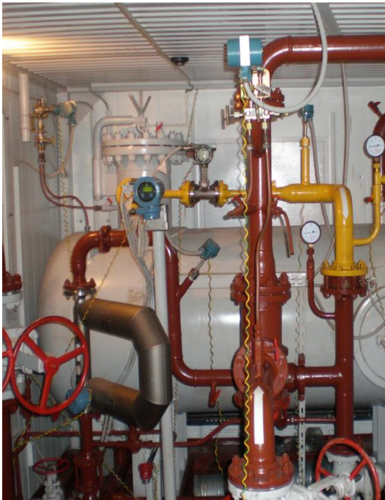
Рисунок 1а - Установка измерительная «Мера-ММ.4Х». Общий вид.