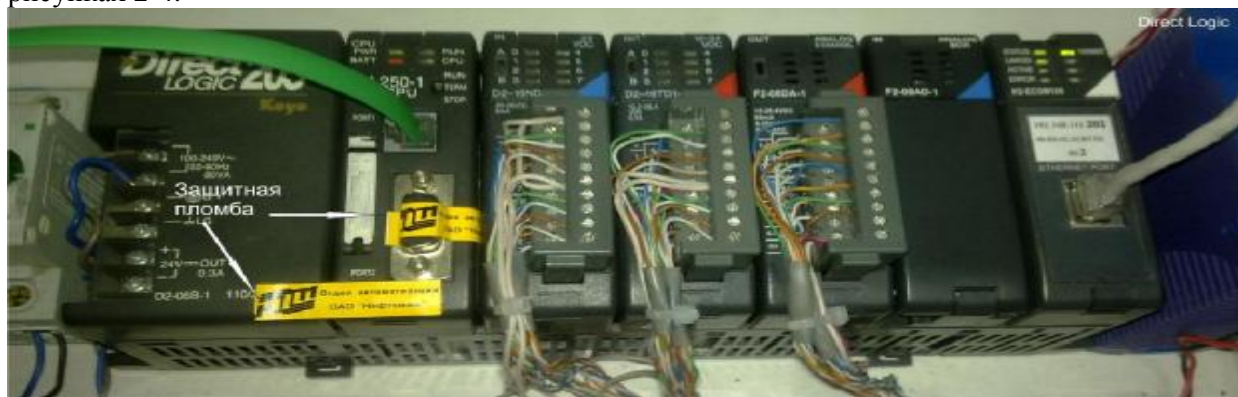
Рисунок 2 - Схема пломбирования контроллера «Direct Logic»

Схемы пломбирования контроллеров от несанкционированного доступа приведены на рисунках 2-4.