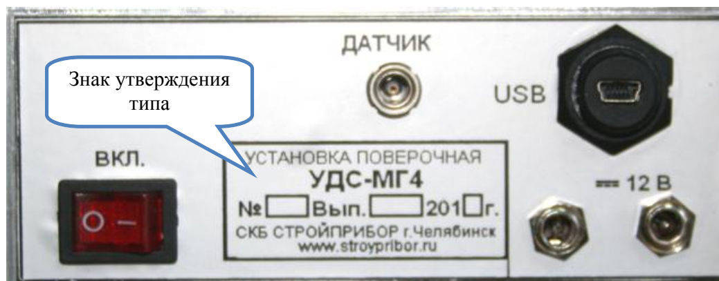
Рисунок 2 – Задняя панель электронного блока УДС-МГ4