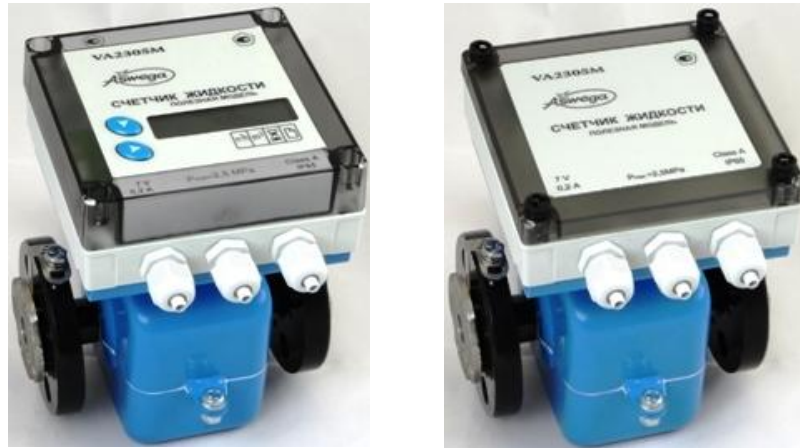
Рисунок 1 – Общий вид счётчика VA2305M (с ЖКИ и без ЖКИ)

Общий вид счётчиков в двух вариантах исполнения (с ЖКИ и без ЖКИ) показан на рисунке 1.