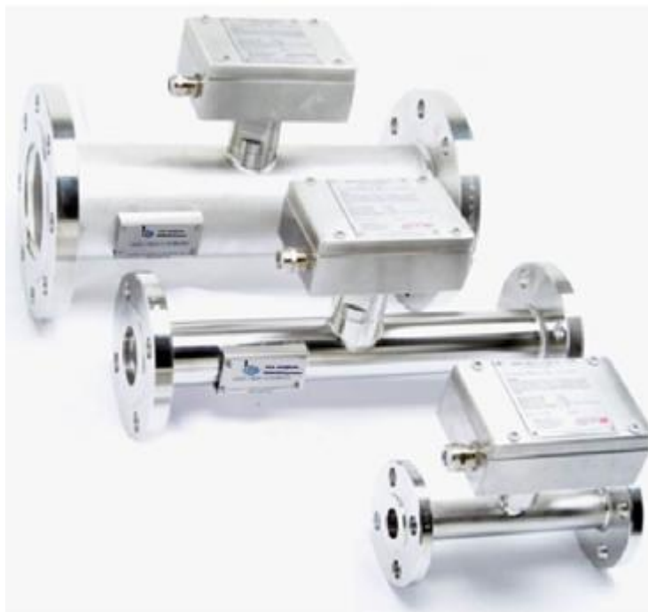
Рисунок 1 - Влагомеры нефти поточные EASZ-1 модели MOD 4300

Принцип действия влагомеров основан на измерении диэлектрических свойств смеси нефть (нефтепродукт) - вода. Цилиндрический датчик расположен внутри измерительного участка, будучи от него изолирован так, чтобы сформировать коаксиальный конденсатор. Исследуемая смесь заполняет межэлектродное пространство конденсатора и изменяет его емкость, которая пропорциональна диэлектрическому коэффициенту. Значение измеренной емкости преобразуется в значение объемного влагосодержания смеси.