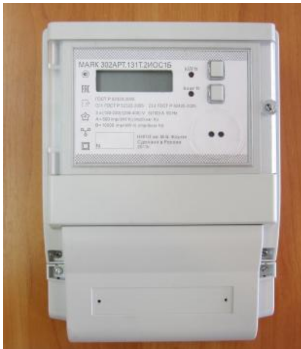
Рисунок 1 – Внешний вид счетчика с закрытой крышкой клеммной колодки

Внешний вид счетчика МАЯК 301АРТ с закрытой крышкой клеммной колодки приведен на рисунке 1. Схема опломбирования приведена на рисунке 2.