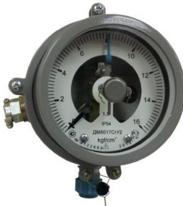
Рисунок 1 - Общий вид прибора

Общий вид прибора приведен на рисунке 1.