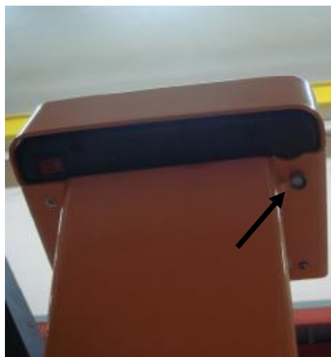
Рисунок 3 Схема пломбировки от несанкционированного доступа и обозначение места для нанесения отпечатка клейма.

В весах предусмотрена защита от несанкционированного изменения установленных регулировок (установленных параметров и регулировки чувствительности (юстировки)) при помощи переключки, расположенной внутри корпуса весов. После поверки весы пломбируются поверителем пломбой, закрывающей доступ внутрь корпуса весов (рисунок 3).