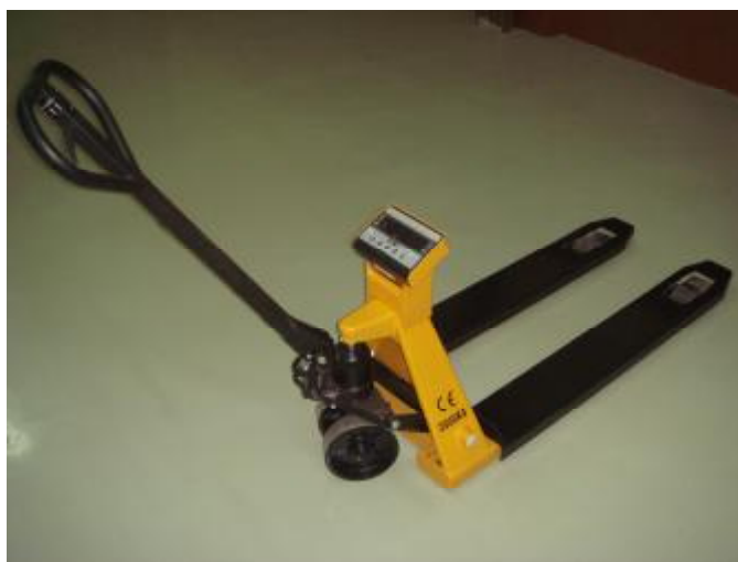
Рисунок 1 Общий вид весов электронных ЕВ4-РТ

И – вариант исполнения дисплея индикатора (Е – светодиодный; С – жидкокристаллический).