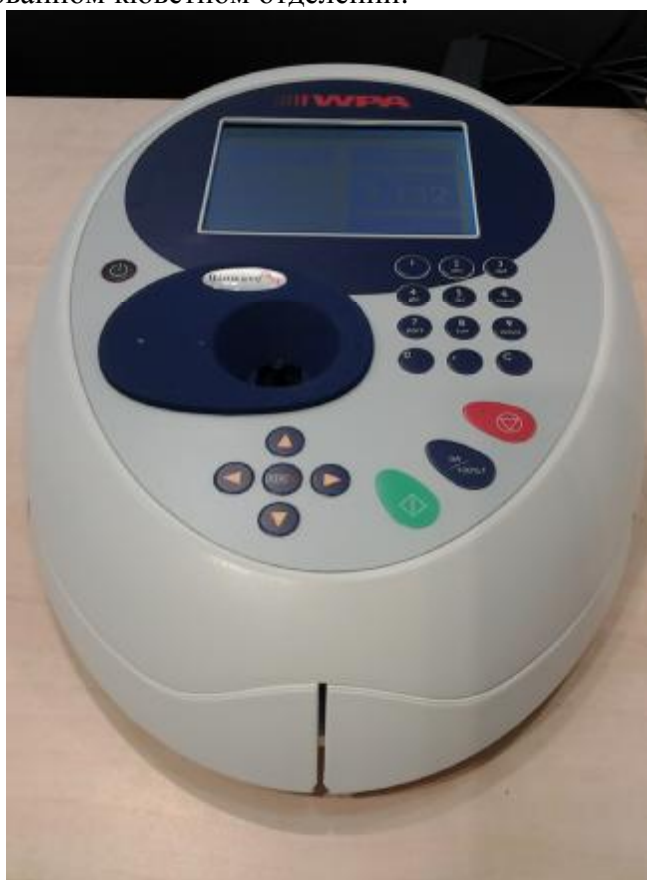
Рисунок 1 – Общий вид спектрофотометра

Спектрофотометры выпускаются в настольном стационарном исполнении со встроенным программным обеспечением. Измерения оптических плотностей жидких проб проводится в специализированном кюветном отделении.