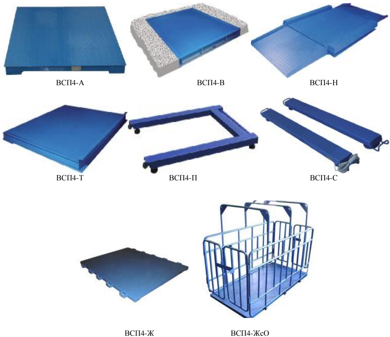
Рисунок 1 — Общий вид ГПУ весов

Общий вид ГПУ весов представлен на рисунке 1.