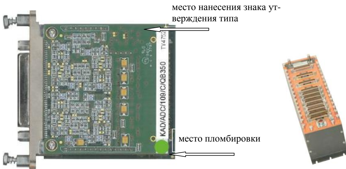
Рисунок 2 - Внешний вид модуля KAD/ADC/109/C/QB350, модуля KAD/ADC/109/C/QB350 и KAD/ADC/109/C/QB120, установленного в блок базовый KAM/CHS/13U