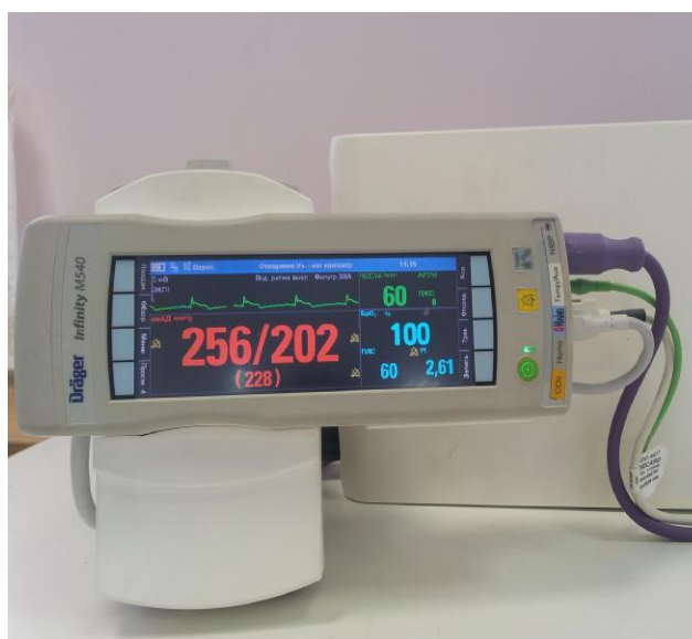
Рисунок 1- Общий вид монитора пациента серии Infinity модели Infinity M540 системы мониторинга физиологических параметров пациента Infinity Acute Care System. Вид спереди