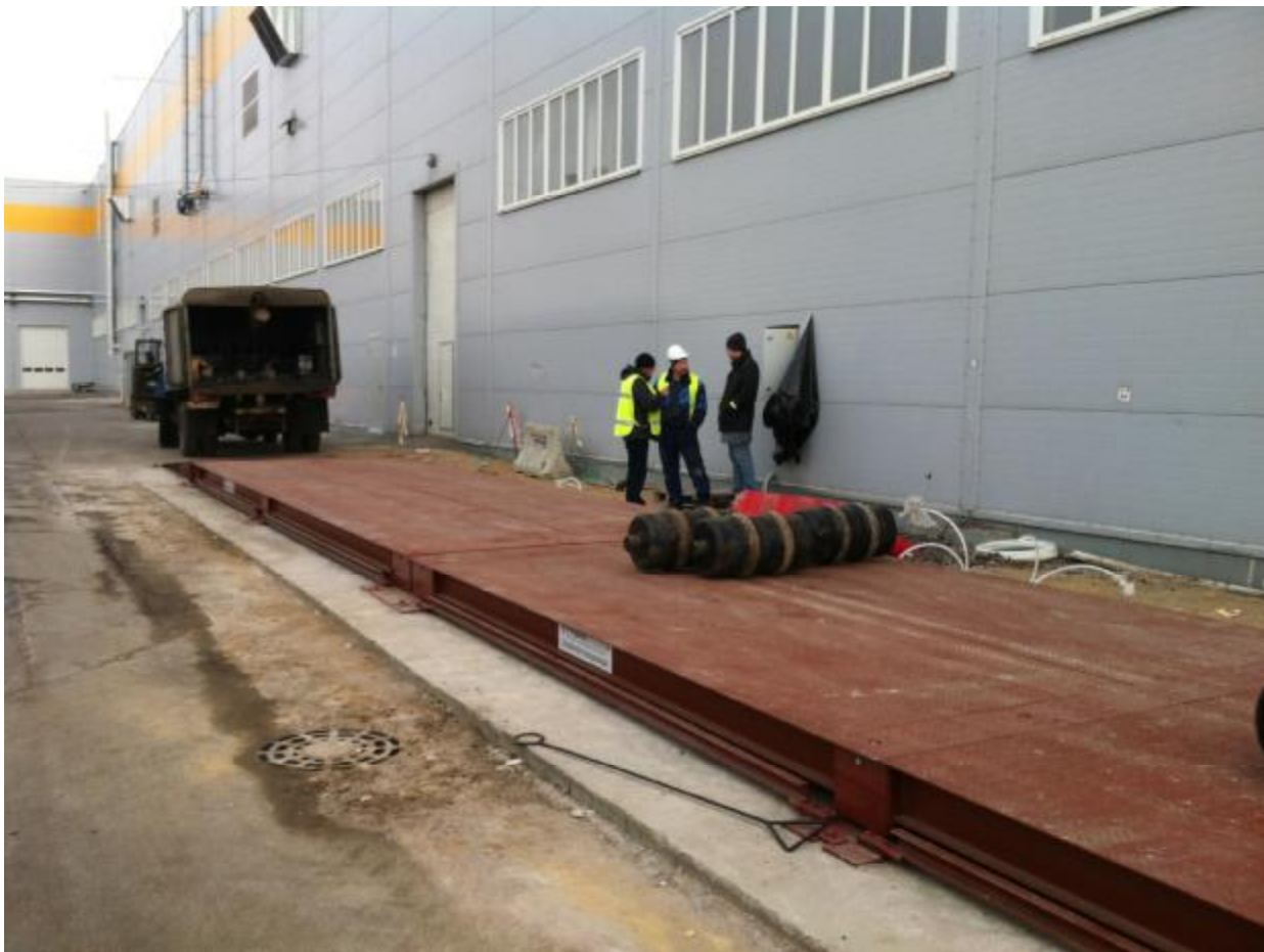
Рисунок 3 Внешний вид весов автомобильных Pfister Mobile SBP/M 18x3/60, зав. № Т 114616861, установленных в ООО «МАН Трак энд Бас Продакшн РУС», г. Санкт-Петербург, Пушкинский район, пос. Шушары