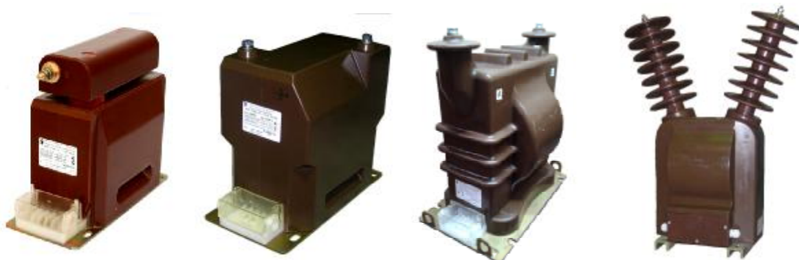
Рисунок 1 - Фотографии общего вида трансформаторов напряжения НОЛ-СЭЩ-6, НОЛ-СЭЩ-10, НОЛ-СЭЩ-20, НОЛ-СЭЩ-35, НОЛ-СЭЩ-35-IV

Принцип действия трансформаторов напряжения основан на явлении электромагнитной индукции переменного тока.