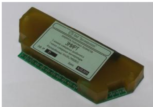
Рисунок 1. Общий вид измерителей