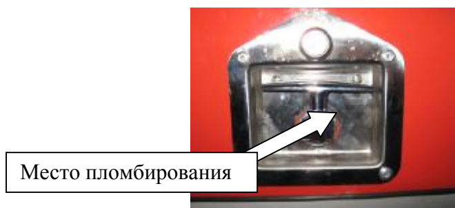
Рисунок 6 – Ручка открывания отсека для размещения узла выдачи топлива АТЗ