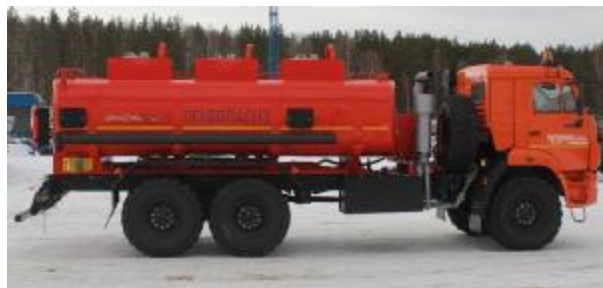
Рисунок 3 – С тремя отсеками