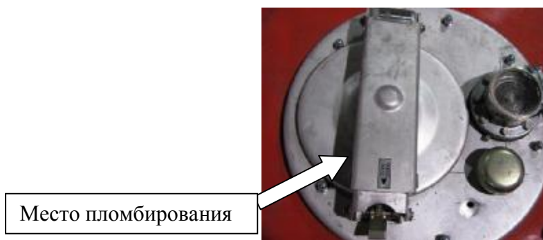
Рисунок 4 – Запорный механизм крышки заливной горловины АТЗ