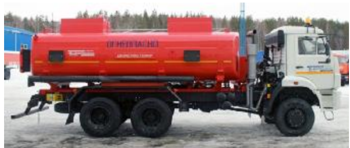
Рисунок 2 – С двумя отсеками