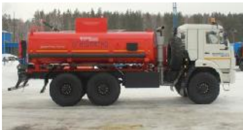
Рисунок 1 – С одним отсеком

Внешний вид АТЗ представлен на рисунке 1, 2, 3. Место пломбирования обозначено на рисунке 4, 5 и 6.