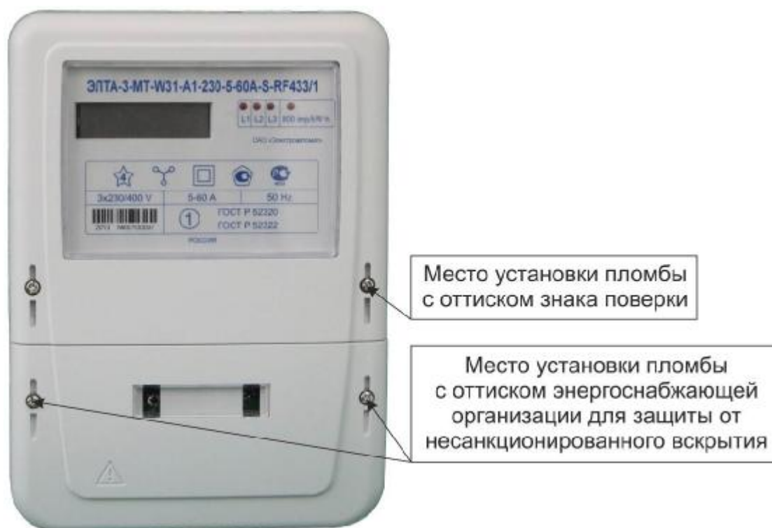
Рисунок 2 – Общий вид счетчика в корпусе модификации W31

Фотографии общего вида счетчиков, с указанием схем пломбировки от несанкционированного доступа, приведены на рисунках 2 – 4.