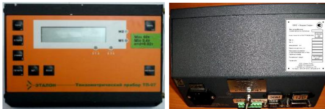
Рисунок 2 – Общий вид тензометрического прибора (индикатора) ТП-07

Аналоговые весоизмерительные датчики, используемые в составе весов – датчики весоизмерительные тензорезисторные С, модификация С16А (Госреестр № 20784-09) фирмы "Hottinger Baldwin Messtechnik GmbH", Германия.