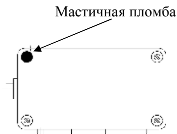
Рисунок 3 — Схема пломбировки соединительной коробки

Схема пломбировки от несанкционированного доступа представлена на рисунке 3, 4.