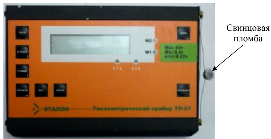
Рисунок 4 – Схема пломбировки тензометрического прибора ТП-07