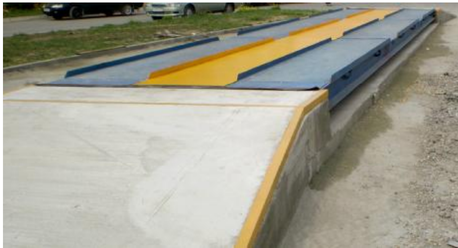
Рисунок 1 – Общий вид ГПУ весов

Сигнальные кабели датчиков подключены к электронному весоизмерительному устройству через соединительную коробку.