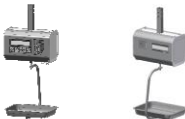
Рисунок 1 Общий вид весов электронных ШТРИХ-ПРИНТ ПВ (вид спереди и вид сзади)

Весы состоят из корпуса, грузоприемного устройства, весоизмерительного устройства, блока клавиатуры, дисплеев массы, цены и стоимости для продавца и покупателя, встроенного принтера для печати этикеток и интерфейса для стыковки с персональным компьютером (ПК) (см. Рисунок 1).