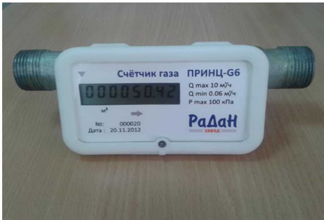
Рисунок 2 - Общий вид счетчика газа «Принц»

Для защиты от несанкционированного доступа счетчики пломбируются с помощью пломбировочной проволоки и пломбы Крабсил. Схема пломбировки счетчиков представлена на рисунке 3.