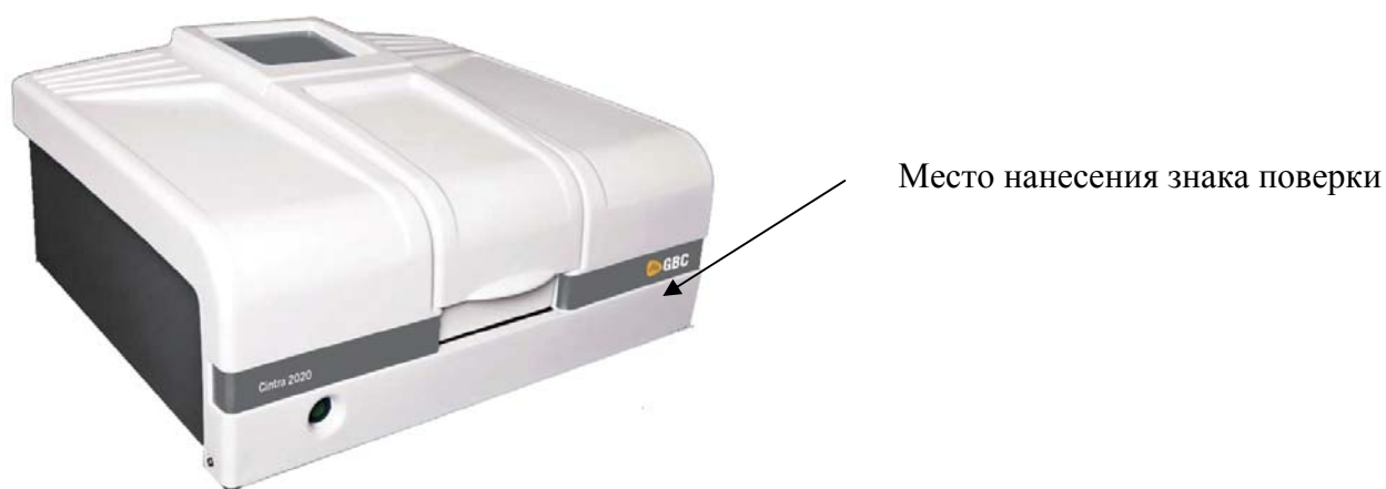
Рисунок 1 - Общий вид спектрофотометров

Место нанесения маркировки и место пломбирования спектрофотометров представлено на рисунке 2.