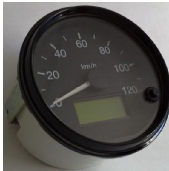
Рисунок 2. Фотография прибора ПА8115