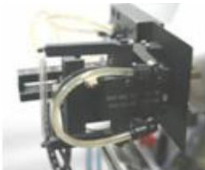
Рисунок 2. Датчики перемещений (деформаций) АС-07-0100