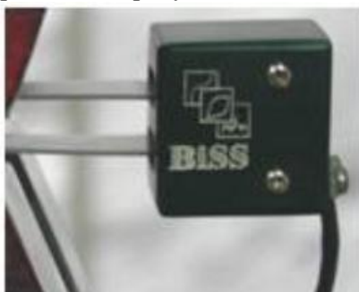
Рисунок 1. Датчики перемещений (деформаций) АС-07-0000

Внешний вид датчиков перемещений (деформаций) АС-07-0000, АС-07-0100, АС-07-1000, АС-07-1100, АС-07-2000 приведен на рисунках 1-5: