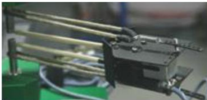
Рисунок 4. Датчики перемещений (деформаций) АС-07-1100