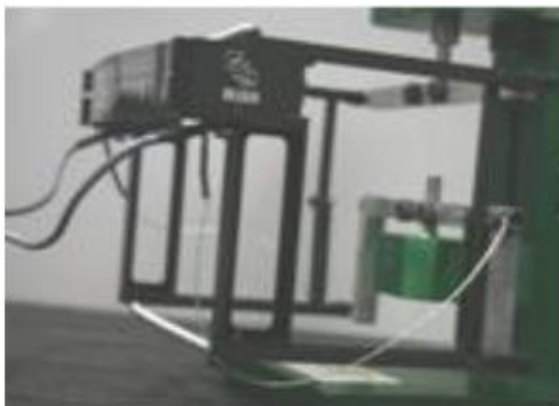
Рисунок 5. Датчики перемещений (деформаций) АС-07-2000