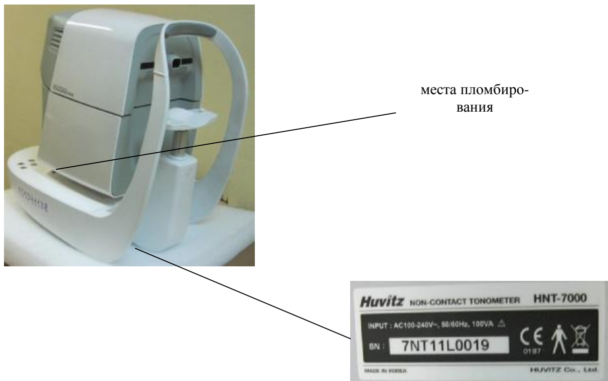
Рисунок 2 – Вид сзади, схема маркировки и места его пломбирования Тонометра HNT-7000.