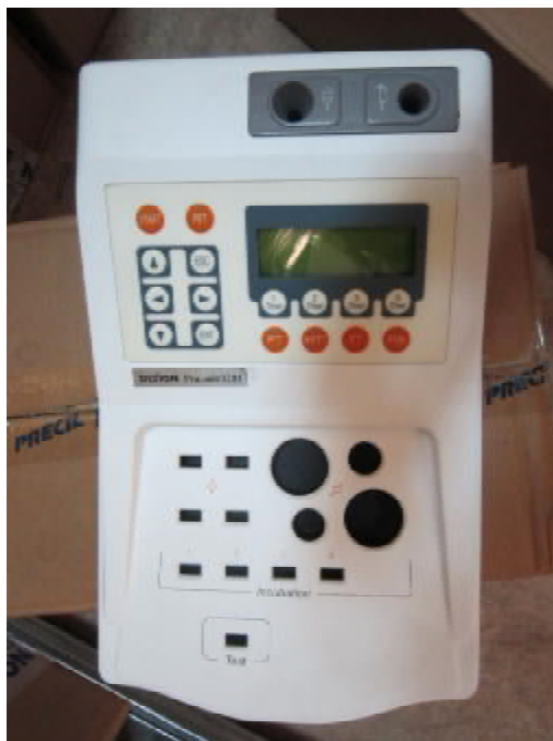
Рисунок 1 – Анализатор полуавтоматический для исследования гемостаза Реалайт модели Реалайт 1201.

Модель Реалайт 1201 имеет 1 измерительный канал, 4 позиции для подогрева и инкубации. Модель Реалайт 1202 имеет 2 измерительных канала, 6 позиций для подогрева и инкубации. Модель Реалайт 1204 имеет 4 измерительных канала, 16 позиций для подогрева и инкубации. Все модели также различаются производительностью и дизайном.