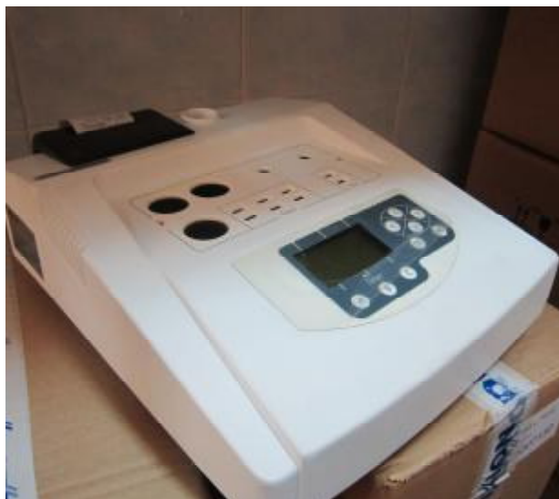
Рисунок 3 – Анализатор полуавтоматический для исследования гемостаза Реалайт модели Реалайт 1202.