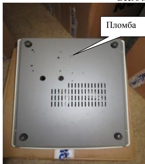
Рисунок 4 – Анализатор полуавтоматический для исследования гемостаза Реалайт модели Реалайт 1202. Расположение пломбы.