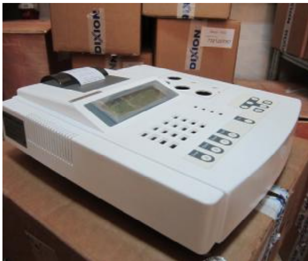
Рисунок 5 – Анализатор полуавтоматический для исследования гемостаза Реалайт модели Реалайт 1204.