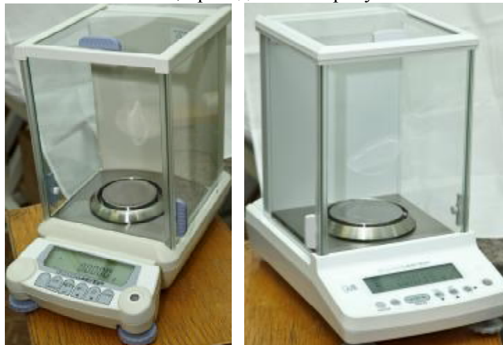
Рисунок 1 - Общий вид весов

Для защиты весов от несанкционированной настройки и вмешательства, которые могут привести к искажению результатов измерений, весы пломбируются контрольными этикетками изготовителя в соответствии со схемой, приведенной на рисунке 2.