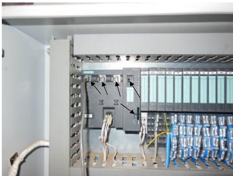
Рисунок 2 - Схема пломбирования контроллера установок