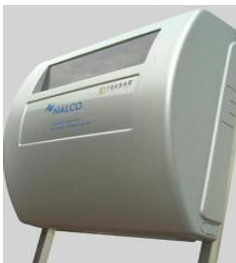
Рисунок 1. Защитная крышка системы.

Общий вид системы приведен на рисунках 1 и 2.