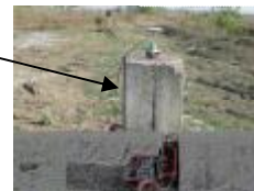
Рисунок 1 - Внешний вид пункта Базиса